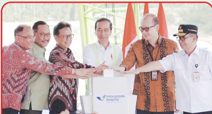
Prosesi groundbreaking Mayapada Hospital di Ibu Kota Nusantara (IKN).