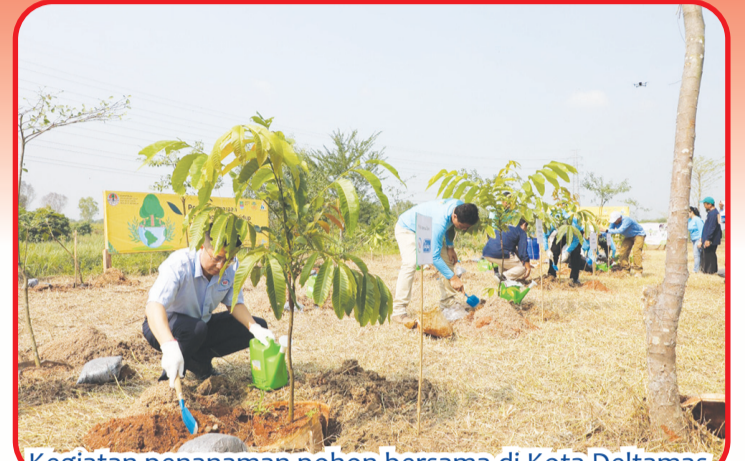
Kegiatan penanaman pohon bersama di Kota Deltamas.

JAKARTA (IM) - Sebagai perusahaan produsen pangan yang memiliki komitmen terhadap pencapaian zero net emission pada tahun 2050, PT Yili Indonesia Dairy, produsen es krim merek Joyday, mengambil peranan aktif salah satunya dengan program penanaman 1.000 pohon bersama di Kota Deltamas.