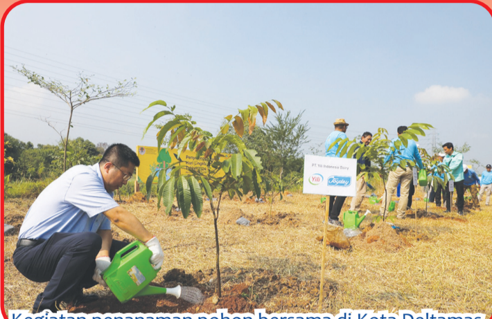
Kegiatan penanaman pohon bersama di Kota Deltamas.