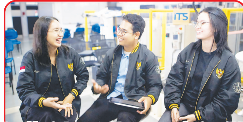
Perwakilan tim Barunastra ITS mempresentasikan inovasi ASV secara daring di NEVA Maritime Congress.